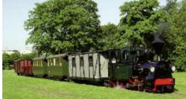
Mit der Feldbahn durch den Rebstockpark.

einen speziellen Stadtteil-Service hinterlegt. Neben allen Haltestellen und Linien im jeweiligen Stadtteil gibt es noch die entsprechenden Kurzstreckenziele und die Fahrpläne zum Download sowie Stadtteilkarten zur besseren Orientierung im Stadtteil.