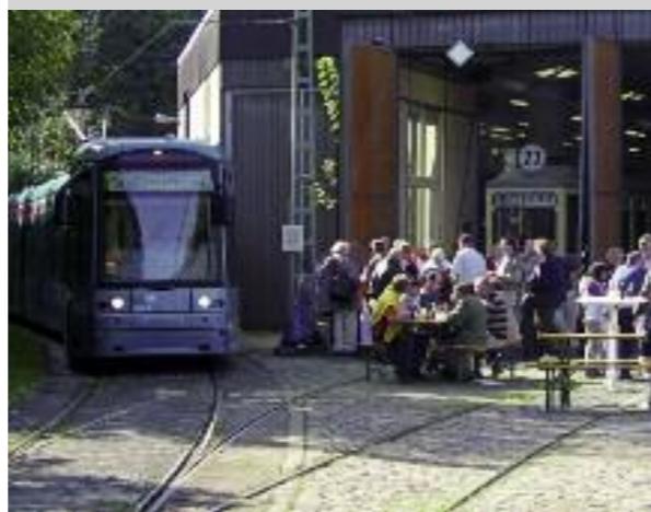
Eine der Stationen am „Tag der Verkehrsgeschichte“: das Verkehrsmuseum in Schwanheim.

Meine Linie Wer regelmäßig mit Bussen und Bahnen unterwegs ist, legt häufig auch die gleichen Wege zurück. Da entsteht schnell ein persönliches Verhältnis zu der „eigenen“ Linie – ob angenehm oder unangenehm, alltäglich oder besonders. Bekannte und weniger bekannte Frankfurter Gesichter stellen in dieser Reihe „ihre Linie“ vor.